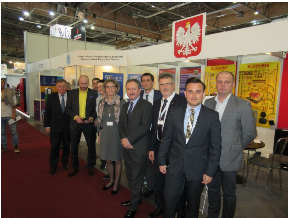
Uczestnicy wspólnego stoiska SEP i Ambasady RP w Pradze, na Targach AMPER 2017