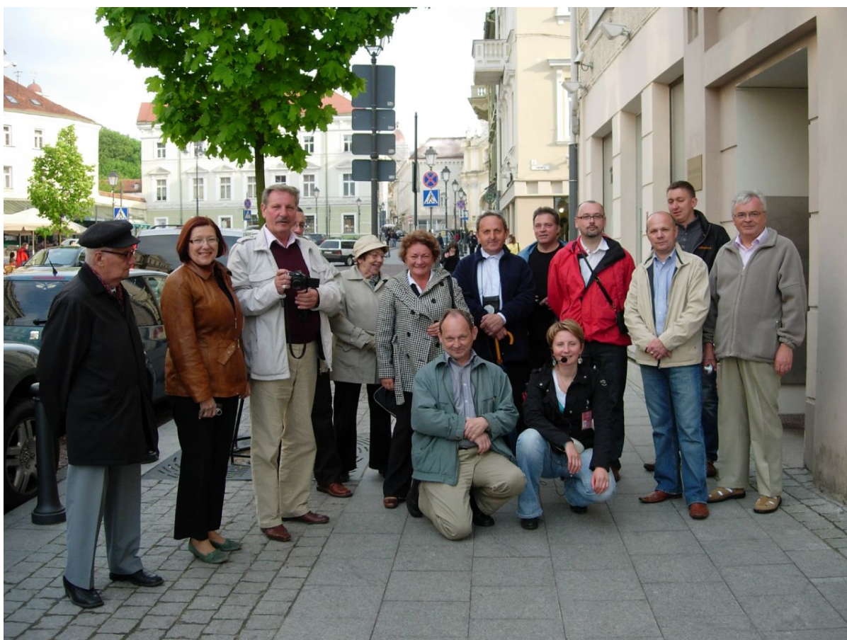
Uczestnicy wyjazdu do Wilna w 2009r.