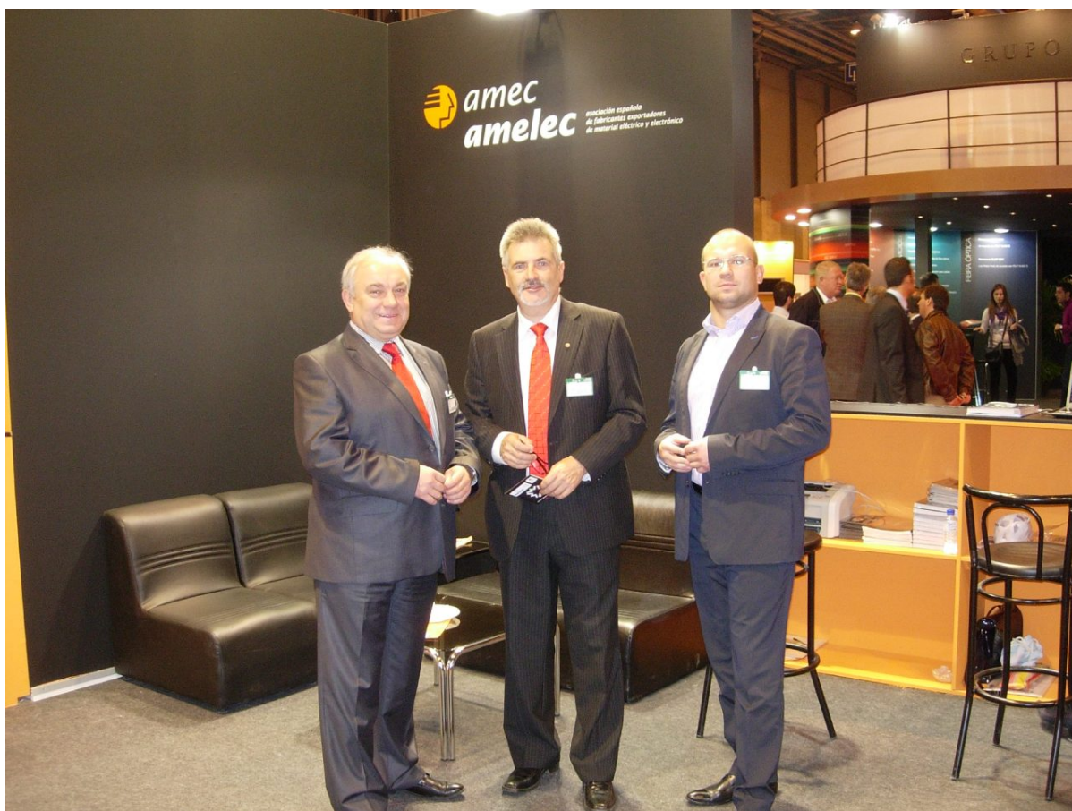
Uczestnicy wyjazdu na Targi MATELEC w 2010r.

💡 ELO SYS – Słowacja – Międzynarodowe Targi Elektrotechniki, Elektroniki, Energetyki i Telekomunikacji (ang. International Exhibition for Electrical Engineering, Power Engineering, Electronics, Lighting and Telecommunications); 2 wyjazdy w latach: 2013; 2014.