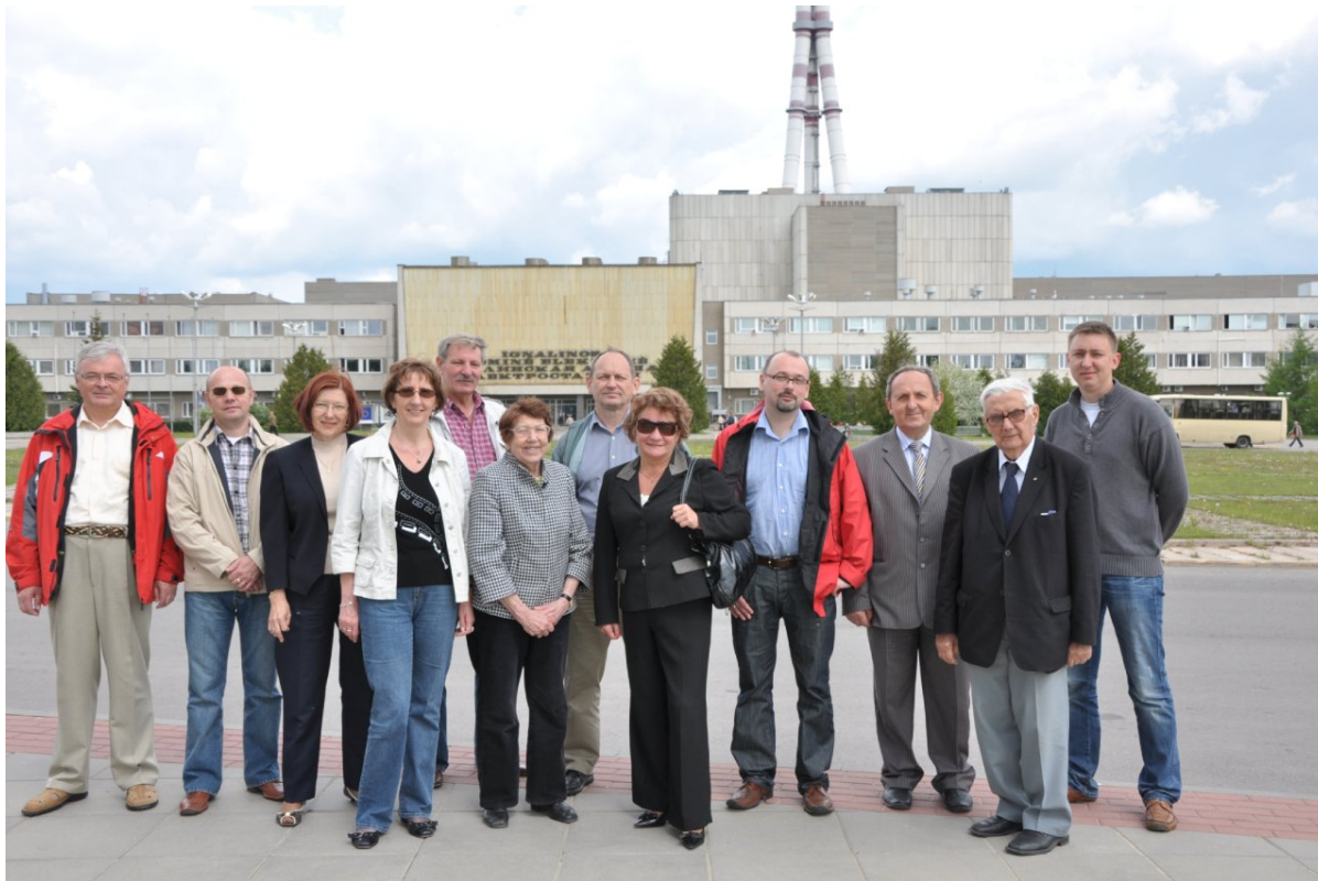
Zdjęcie na tle Elektrowni Atomowej w Ignalinie